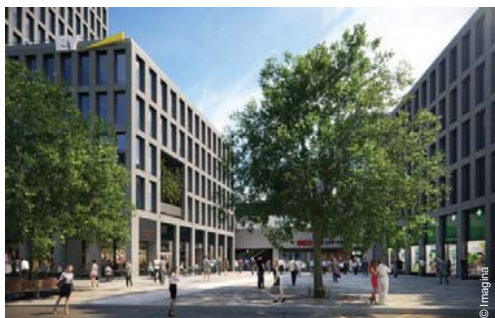
Esplanade au cœur du nouveau quartier d'activités (2)