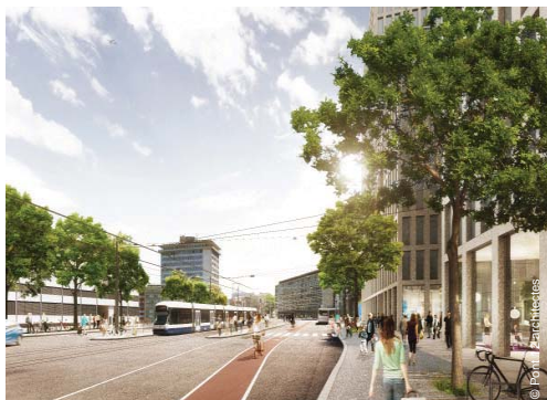
Réaménagement de la route du Grand-Lancy (1)