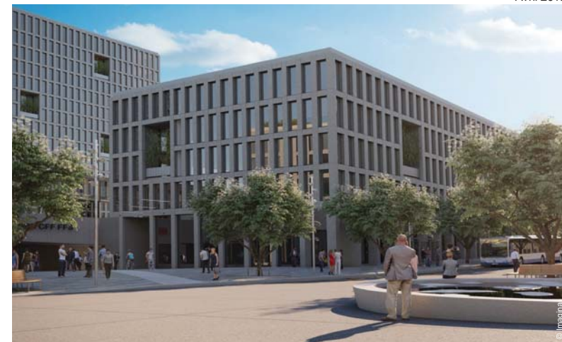
Place de la gare