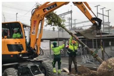
Plantation route du Grand-Lancy