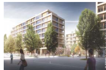
Logements du quartier de l'Adret

Le projet de l'Adret, prévoit la construction de 640 logements, dont 80% de logements d'utilité publique, et accueillera 1800 habitants environ.