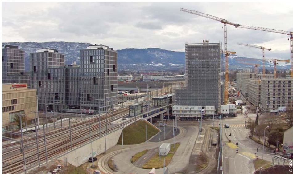
Etat d'avancement des chantiers - Février 2019