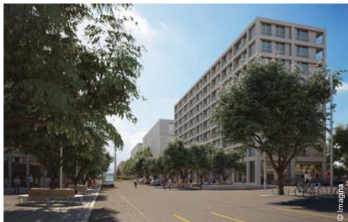
La place de Pont-Rouge (4)