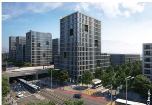
Passage inférieur central avec voie tram (3)